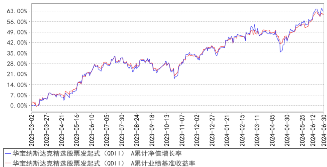
华宝纳斯达克精选股票发起式（QDII） A累计净值增长率与同期业绩比较基准收益率的历史走势对比图