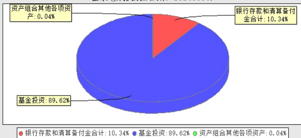
华宝稳健养老目标一年持有期混合型发起式基金中基金(FOF)投资组合资产配置图表(数据截止日期:20240331)