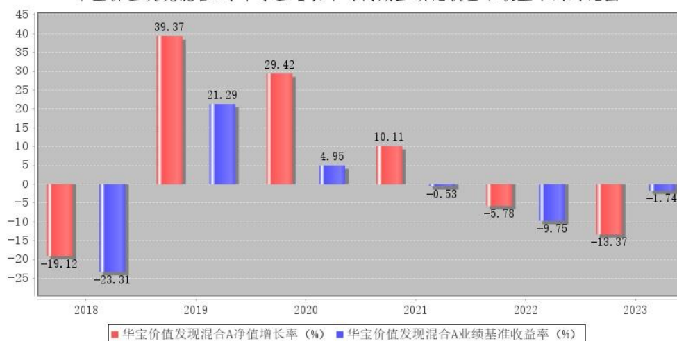
华宝价值发现混合A每年净值增长率与同期业绩比较基准收益率的对比图