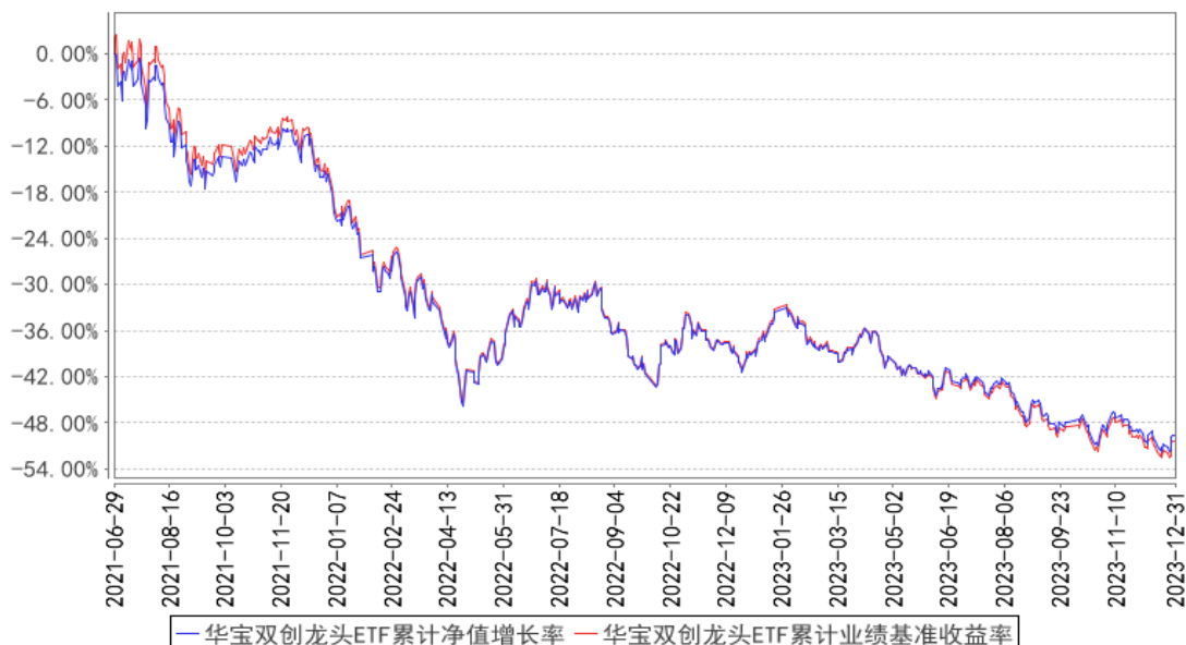
华宝双创龙头ETF累计净值增长率与同期业绩比较基准收益率的历史走势对比图

注：按照基金合同的约定，基金管理人应当自基金合同生效之日起6个月内使基金的投资组合比例符合基金合同的有关约定，截至2021年12月29日，本基金已达到合同规定的资产配置比例。