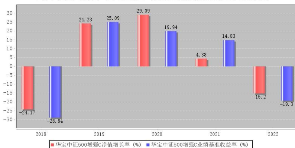
华宝中证500增强C每年净值增长率与同期业绩比较基准收益率的对比图