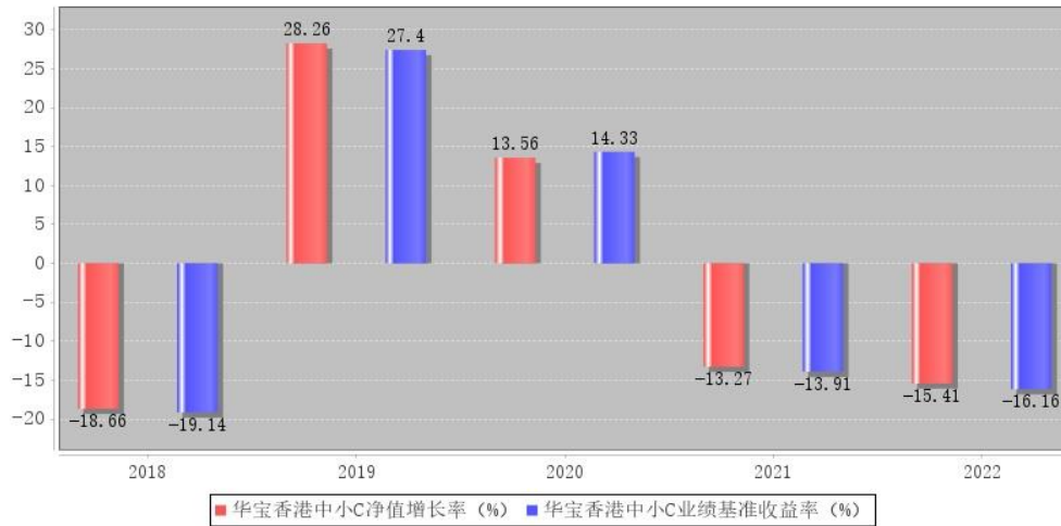
华宝香港中小C每年净值增长率与同期业绩比较基准收益率的对比图