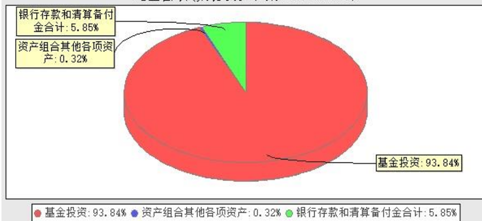
华宝中证科技龙头交易型开放式指数证券投资基金发起式联接基金投资组合资产配置图表(数据截止日期: 20230930)