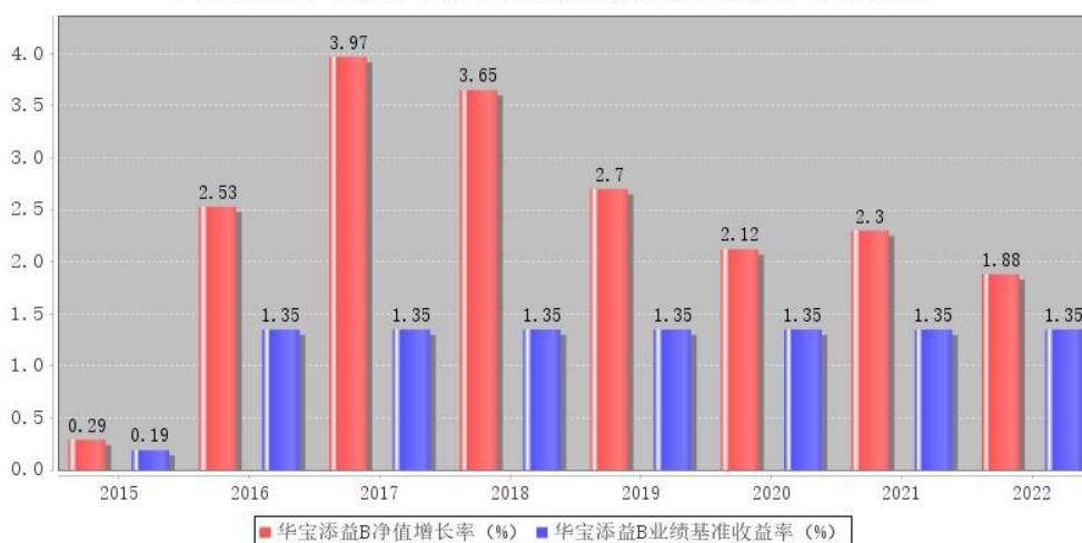
华宝添益B每年净值增长率与同期业绩比较基准收益率的对比图