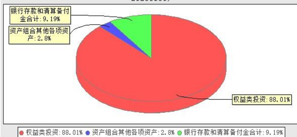
华宝医药生物优选混合型证券投资基金投资组合资产配置图表(数据截止日期: 20230630)