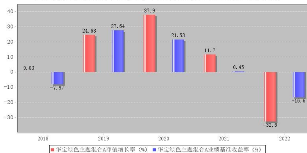
华宝绿色主题混合A每年净值增长率与同期业绩比较基准收益率的对比图