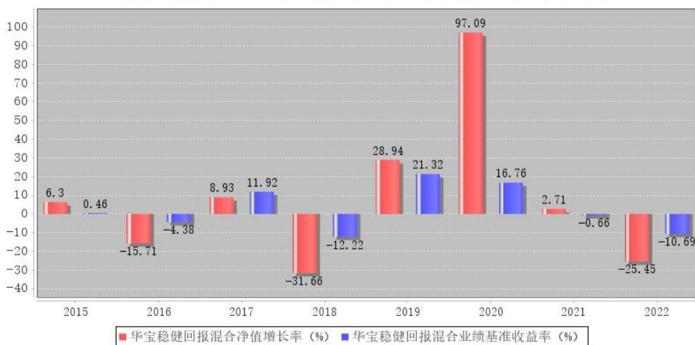
华宝稳健回报混合每年净值增长率与同期业绩比较基准收益率的对比图