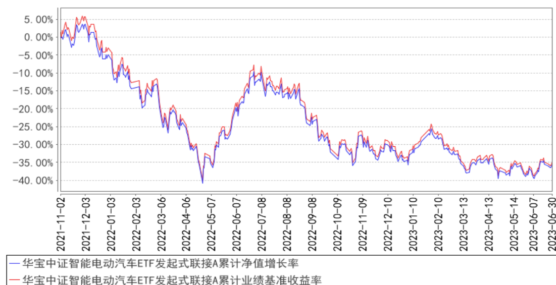
华宝中证智能电动汽车ETF发起式联接A累计净值增长率与同期业绩比较基准收益率的历史走势对比图