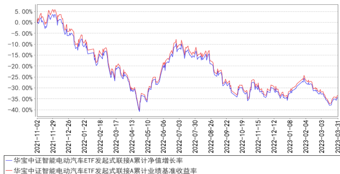
华宝中证智能电动汽车ETF发起式联接A累计净值增长率与同期业绩比较基准收益率的历史走势对比图