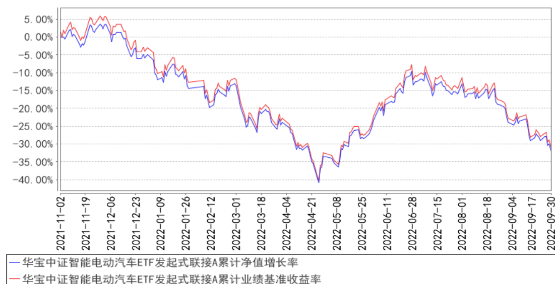
华宝中证智能电动汽车ETF发起式联接A累计净值增长率与同期业绩比较基准收益率的历史走势对比图