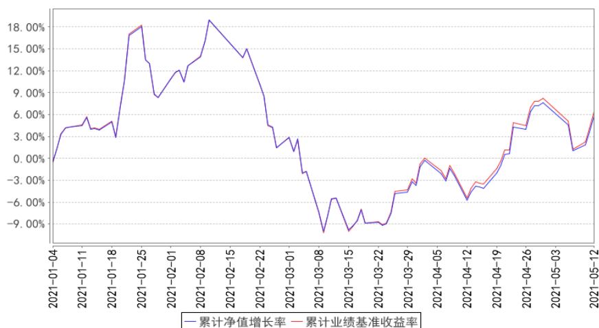
华宝中证医疗指数累计净值增长率与同期业绩比较基准收益率的历史走势对比图

注：本基金转型日期为 2021 年 1 月 1 日，截止至本报告期末，本基金转型未满一年。